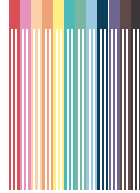
12 feutres de couleur