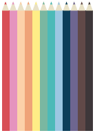
12 crayons de couleur

L'élève inscrit en CP, CE1, CE2, CM1 et CM2 apportera le jour de la rentrée les fournitures personnelles suivantes: